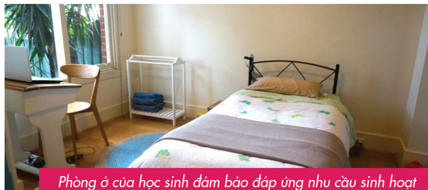
Phòng ở của học sinh đảm bảo đáp ứng nhu cầu sinh hoạt