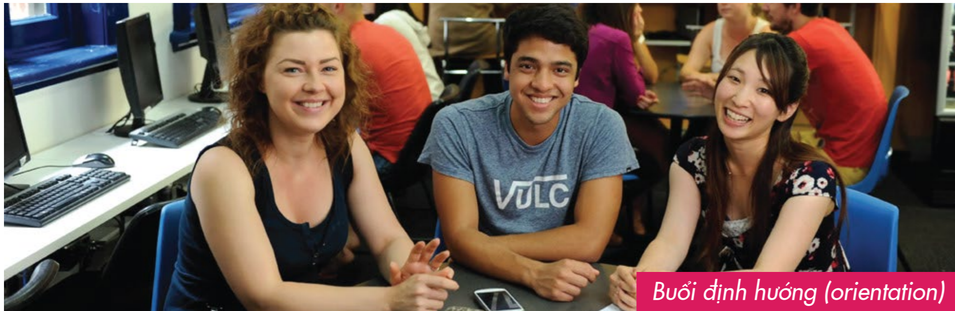
Buổi định hướng (orientation)