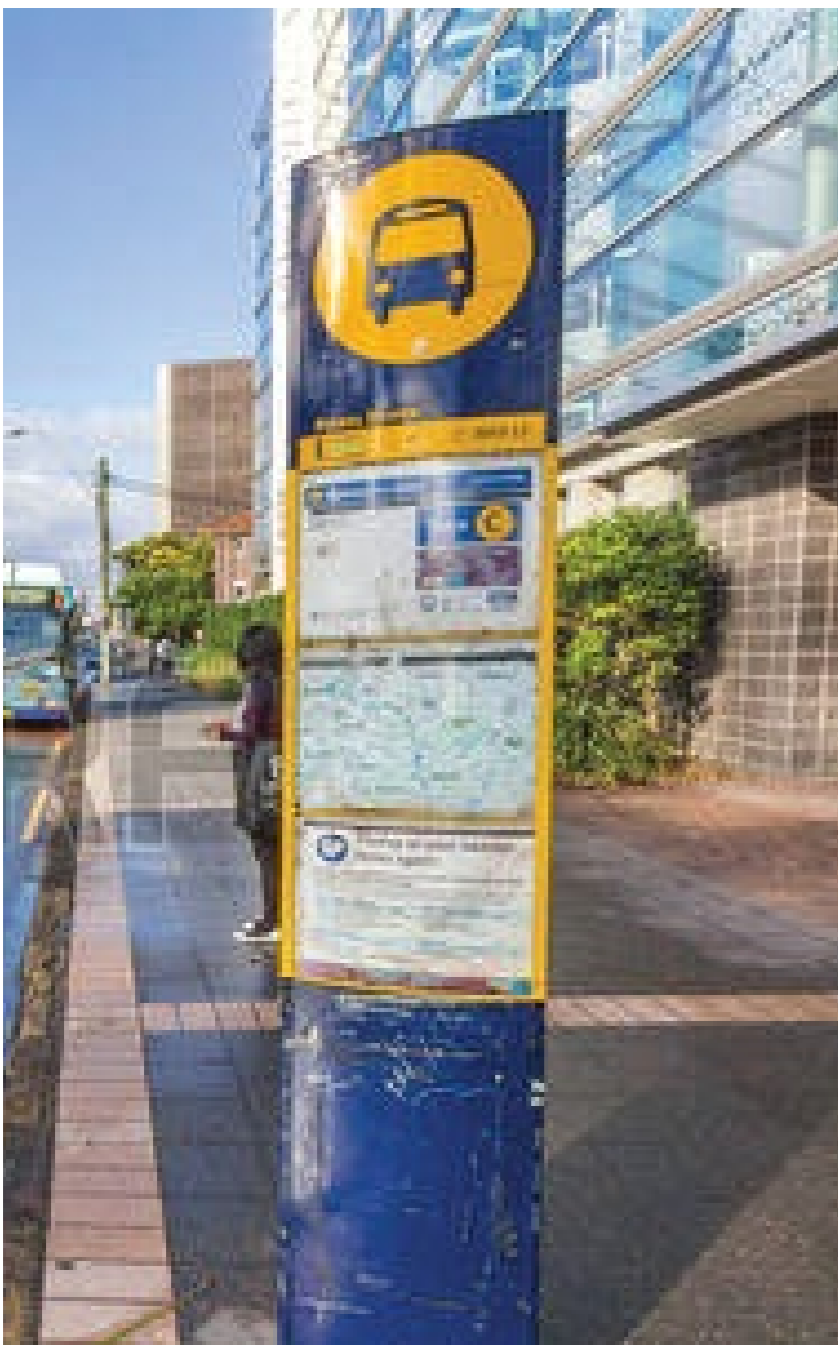
IH Sydney nằm ở khu vực trung tâm, giao thông thuận tiện.