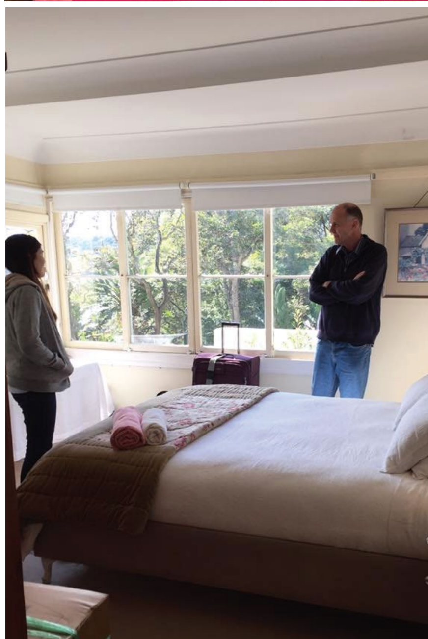
Chủ nhà homestay được cấp giấy phép của chính phủ.

Du học hè 2018 tại Sydney cùng Annalink/OSHCstudents, học sinh được trải nghiệm sống cùng người bản xứ tại mô hình nhà homestay. Ở đây các em không chỉ tăng thêm vốn tiếng Anh qua giao tiếp hàng ngày mà còn được tiếp cận với môi trường sống "rất Úc" với những nét văn hóa đặc trưng của con người thân thiện nơi đây.