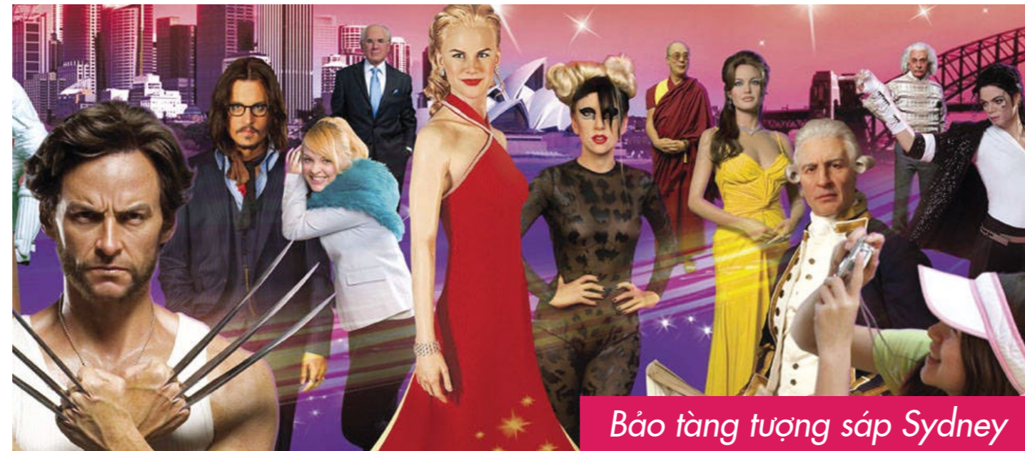
Bảo tàng tượng sáp Sydney