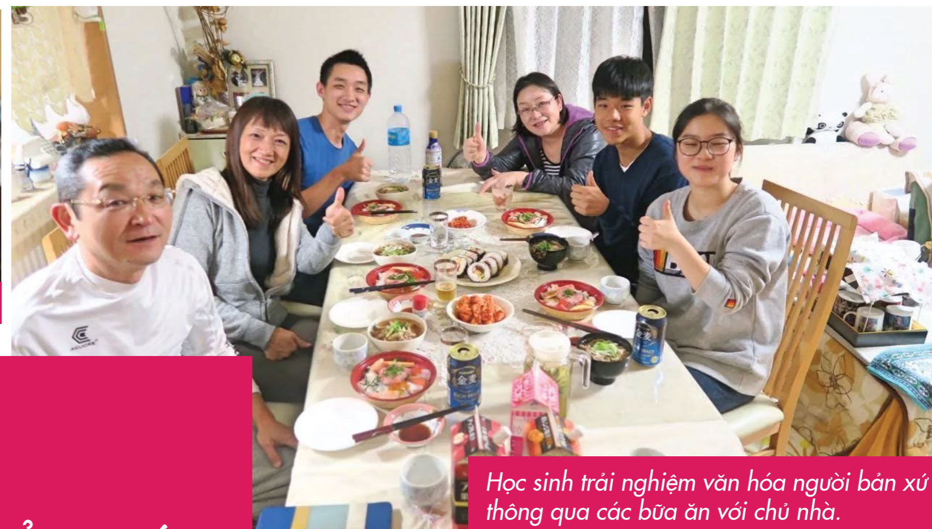
Học sinh trải nghiệm văn hóa người bản xứ thông qua các bữa ăn với chủ nhà.