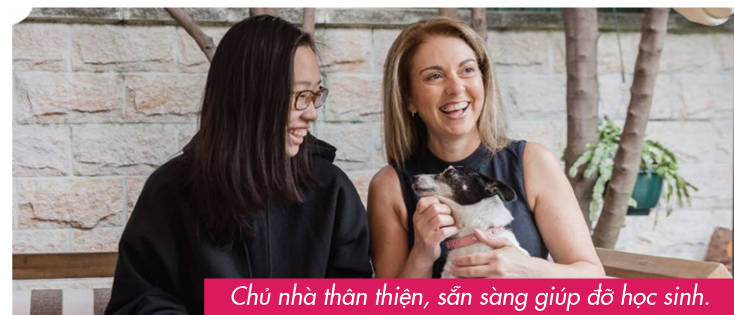
Chủ nhà thân thiện, sẵn sàng giúp đỡ học sinh.