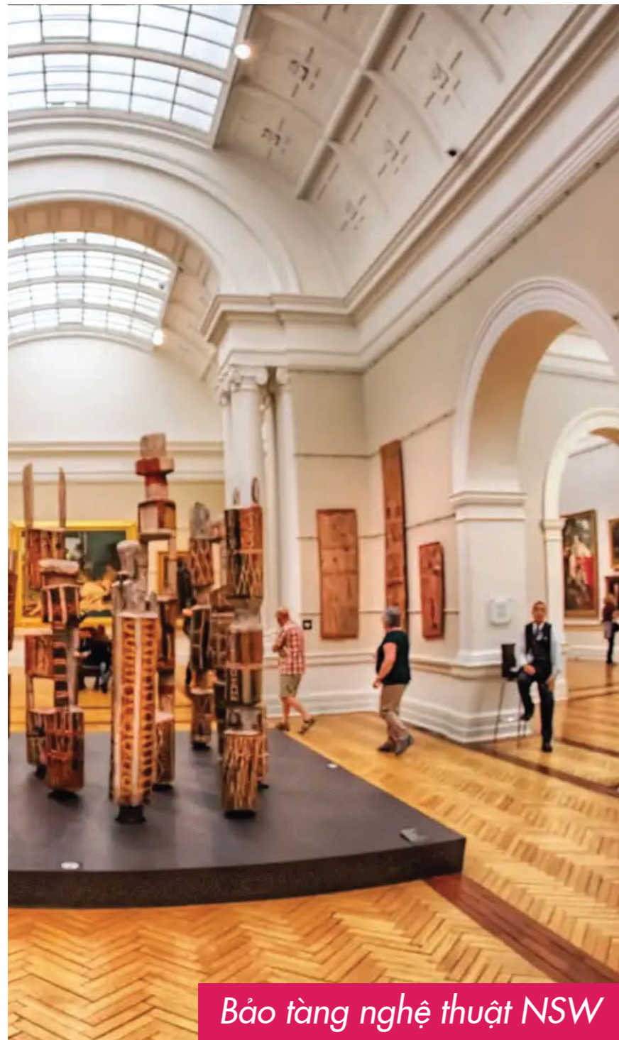
Bảo tàng nghệ thuật NSW