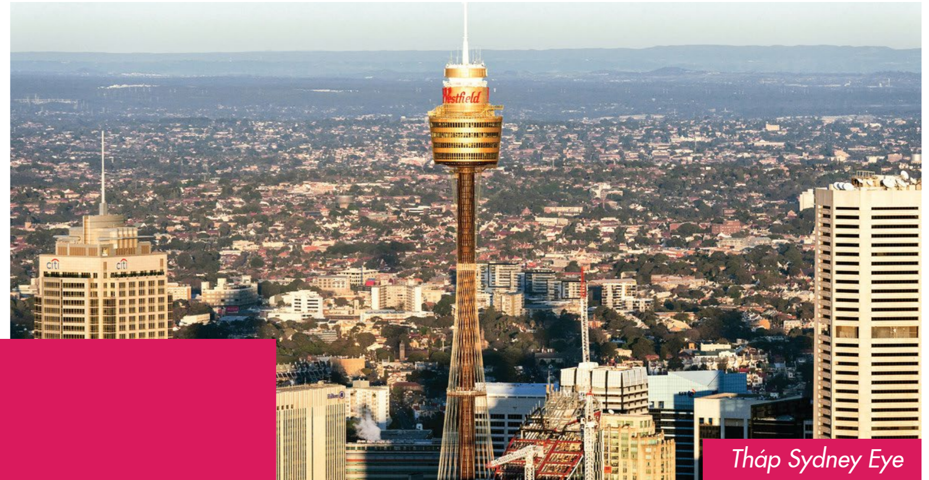
Tháp Sydney Eye