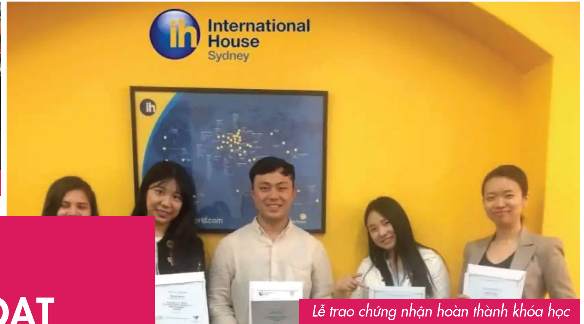
Lễ trao chứng nhận hoàn thành khóa học