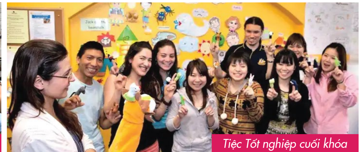
Tiệc Tốt nghiệp cuối khóa