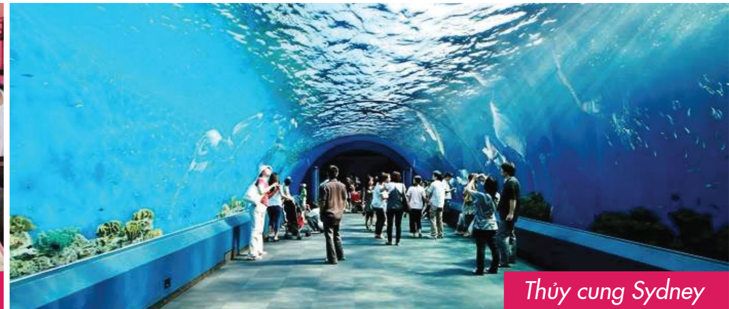
Thủy cung Sydney