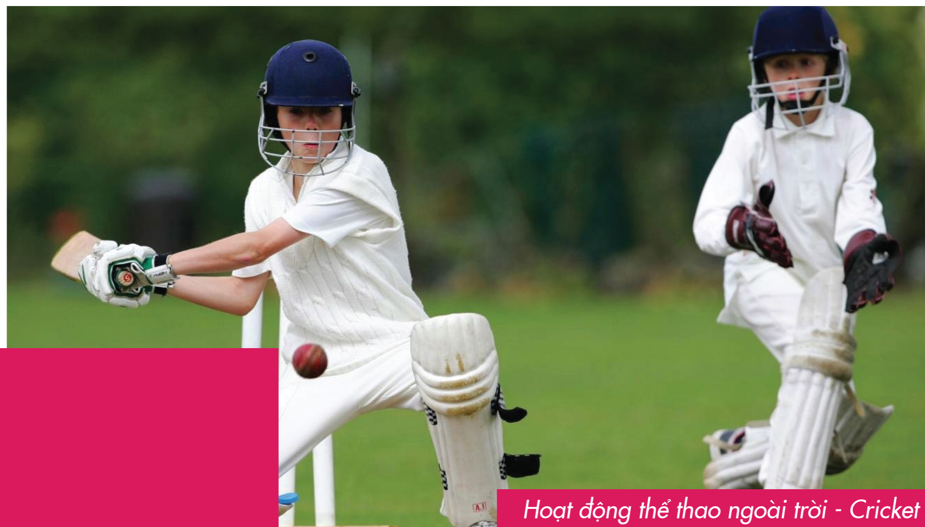
Hoạt động thể thao ngoài trời - Cricket