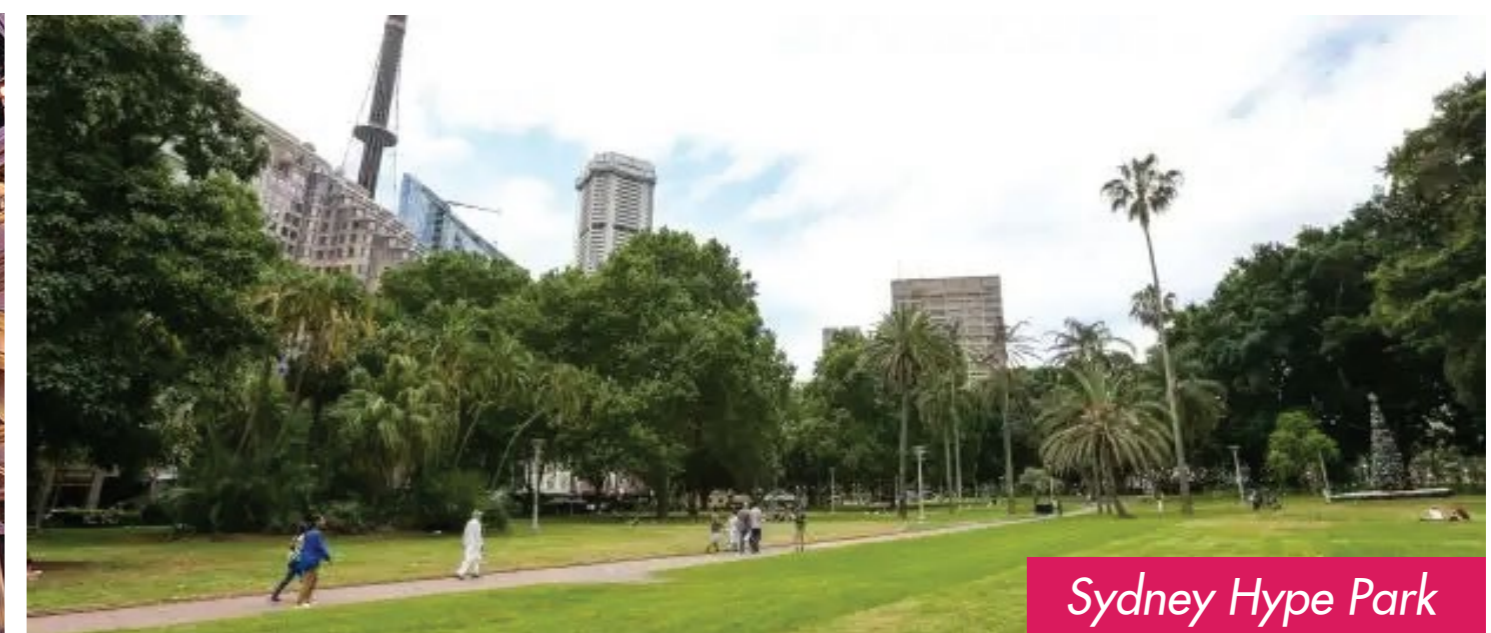
Sydney Hype Park