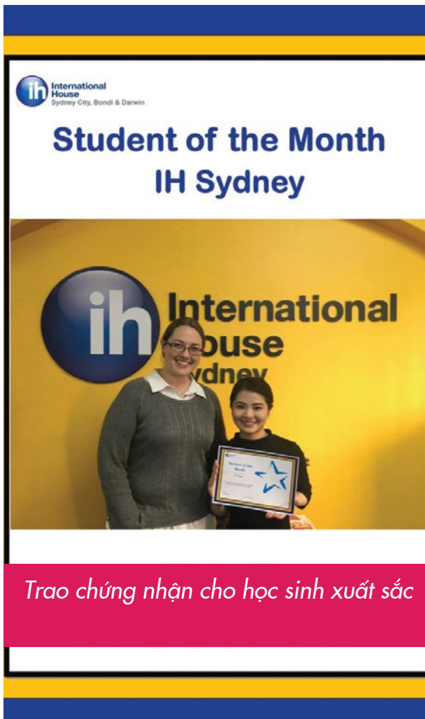
Trao chứng nhận cho học sinh xuất sắc