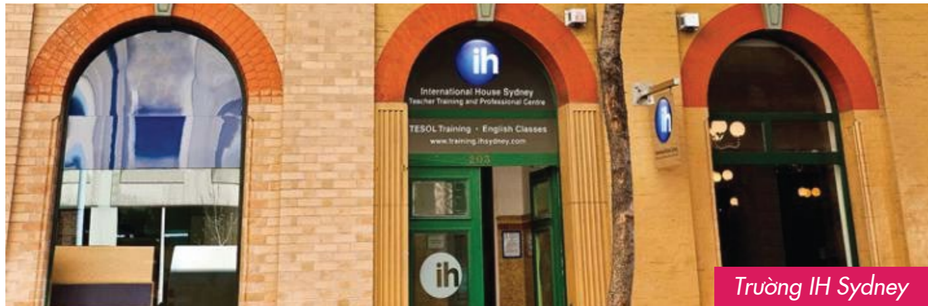
Trường IH Sydney