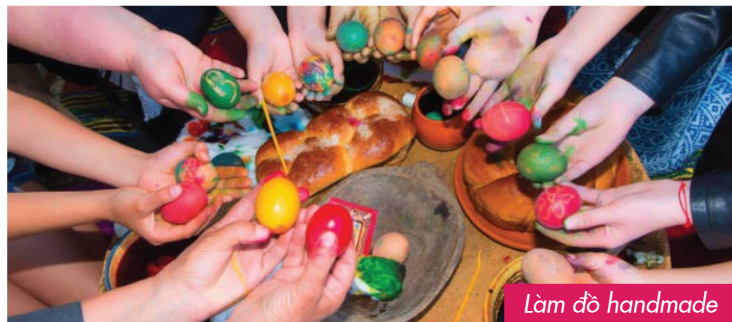
Làm đồ handmade