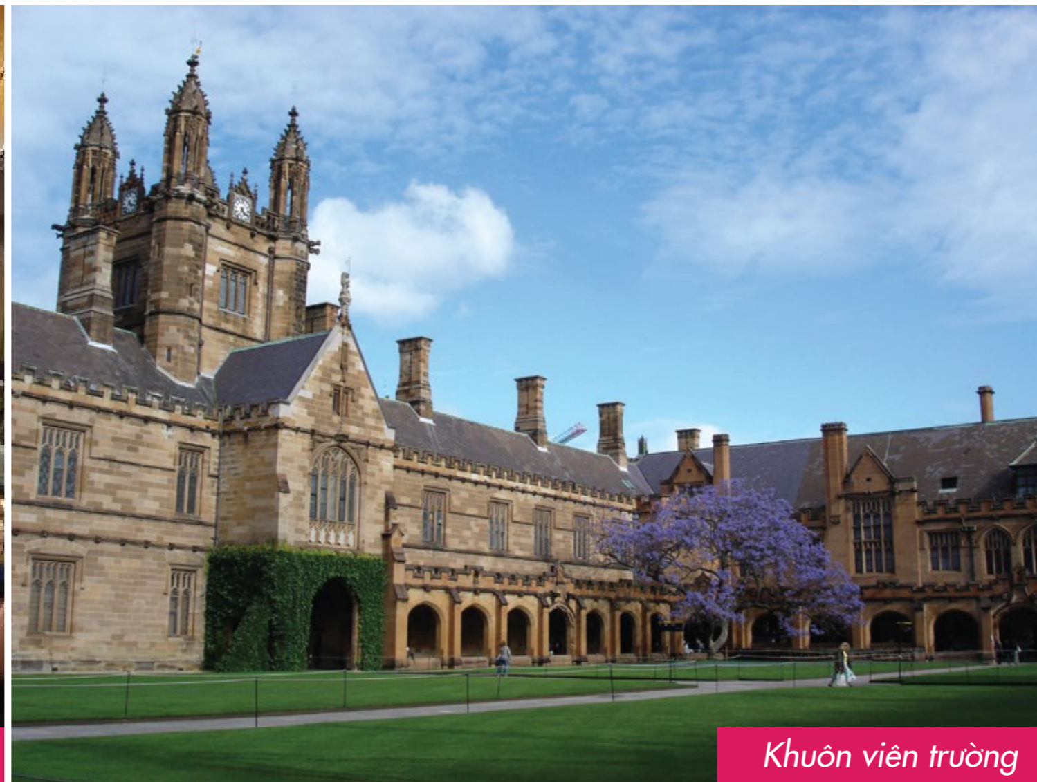
Khuôn viên trường