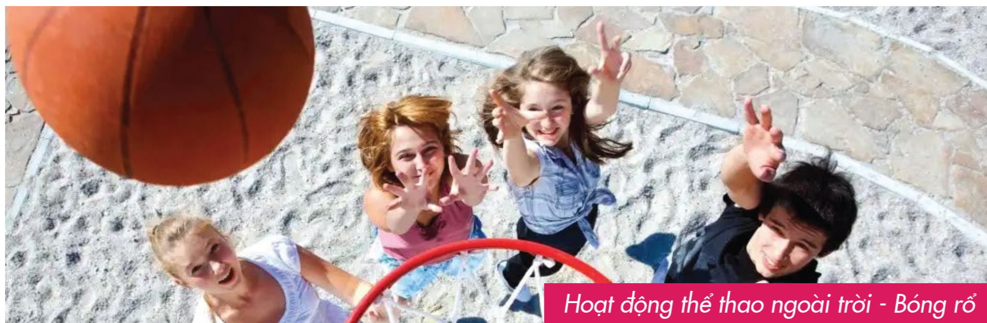
Hoạt động thể thao ngoài trời - Bóng rổ