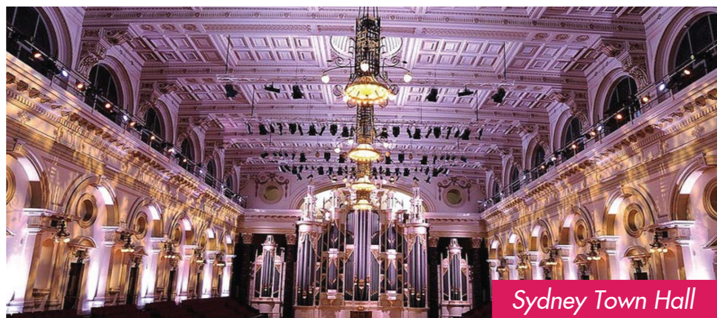
Sydney Town Hall