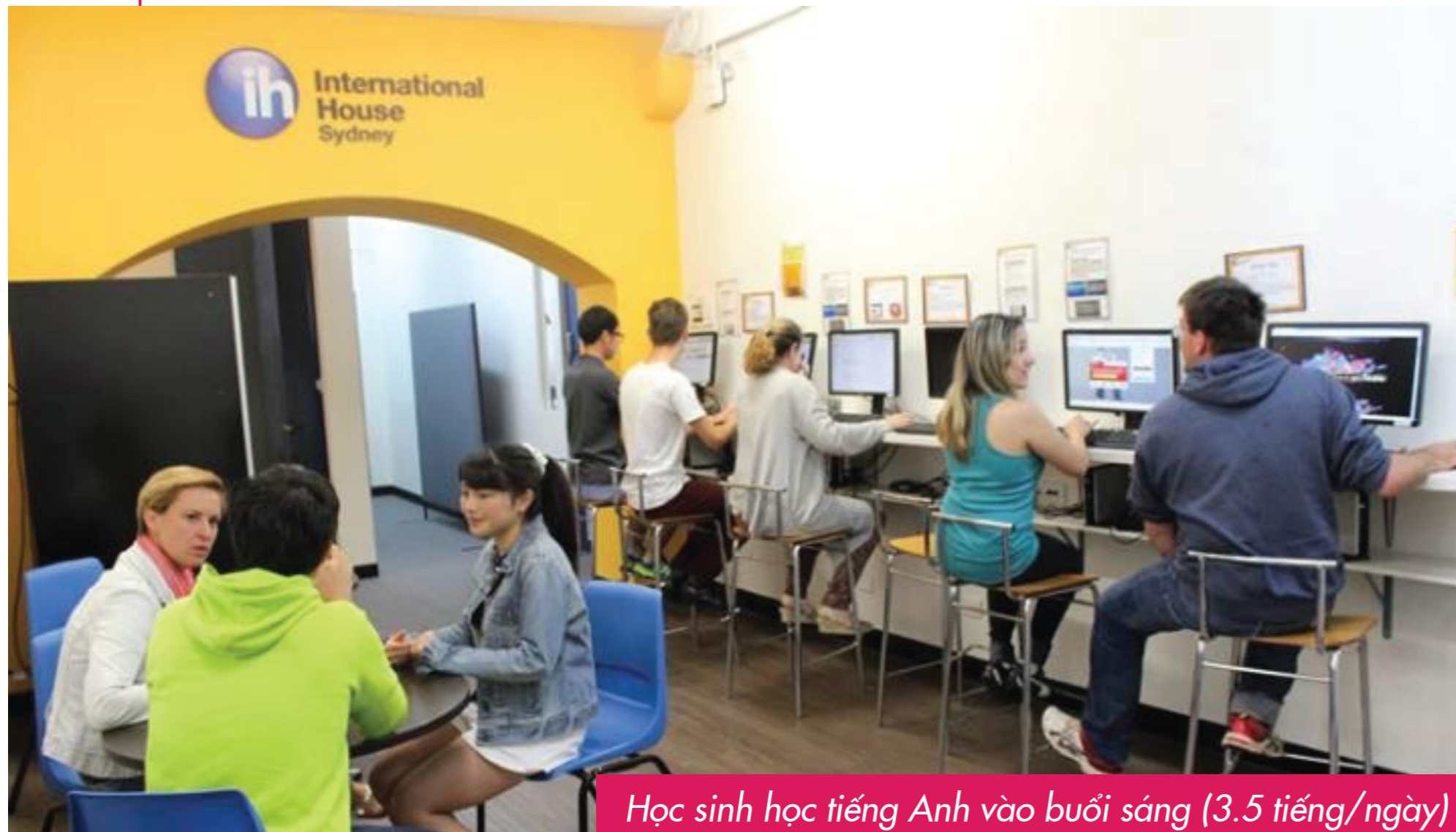
Học sinh học tiếng Anh vào buổi sáng (3.5 tiếng/ngày)