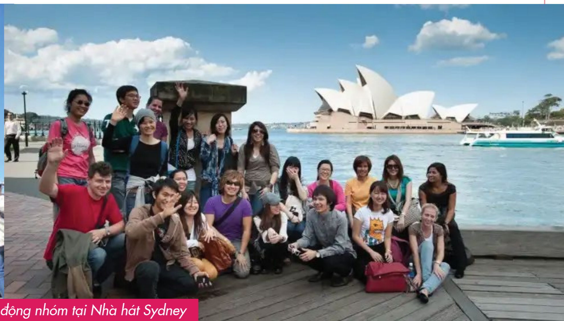
Học sinh tham quan, chụp ảnh & hoạt động nhóm tại Nhà hát Sydney