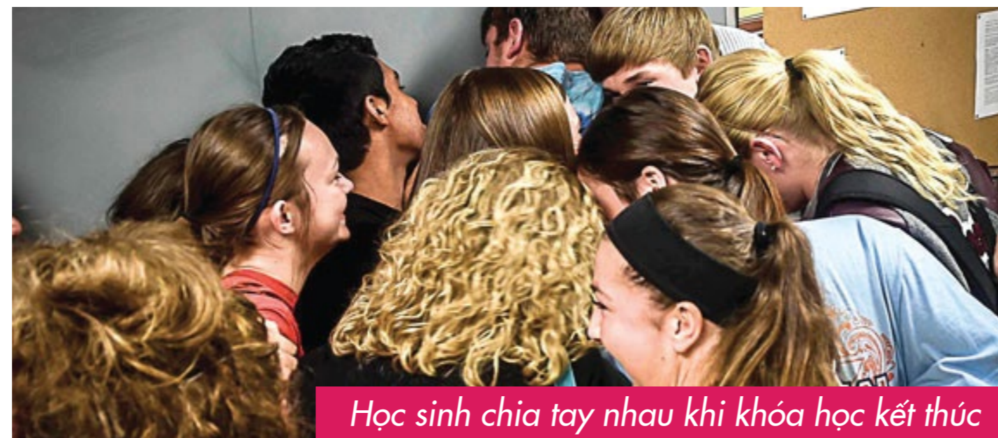
Học sinh chia tay nhau khi khóa học kết thúc

Nhiều học sinh khi về nhà thường bị Campsick vì nhớ thời gian đi du học hè và bạn bè, cũng như muốn tiếp tục tham gia vào năm tiếp theo.