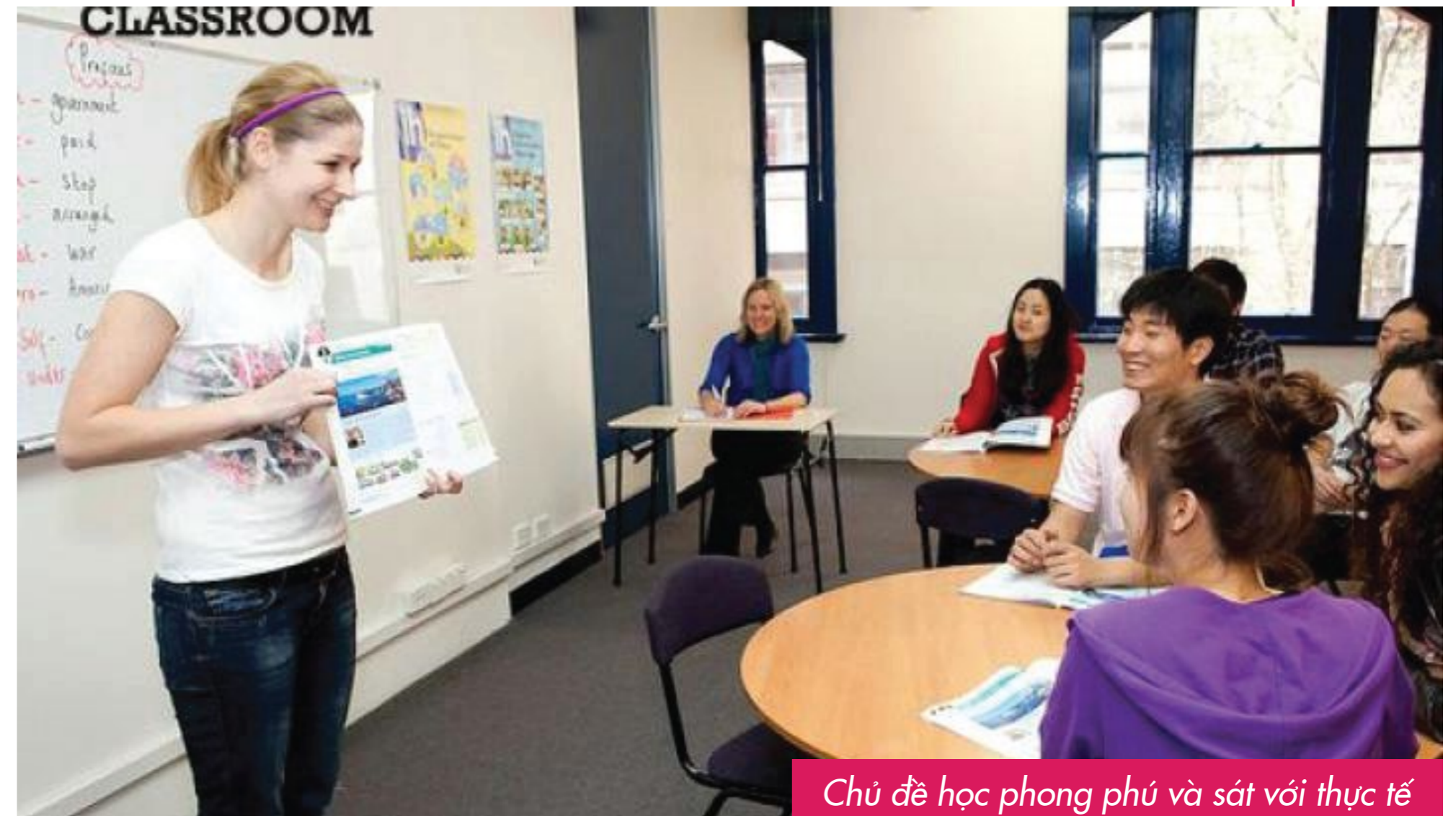
Chủ đề học phong phú và sát với thực tế