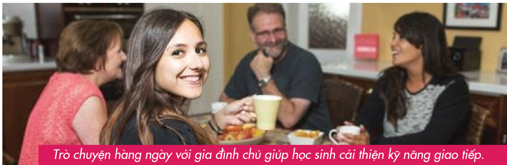
Trò chuyện hàng ngày với gia đình chủ giúp học sinh cải thiện kỹ năng giao tiếp.