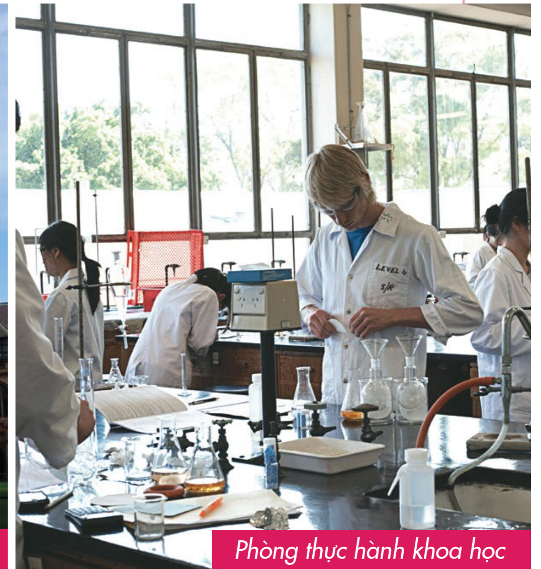
Phòng thực hành khoa học